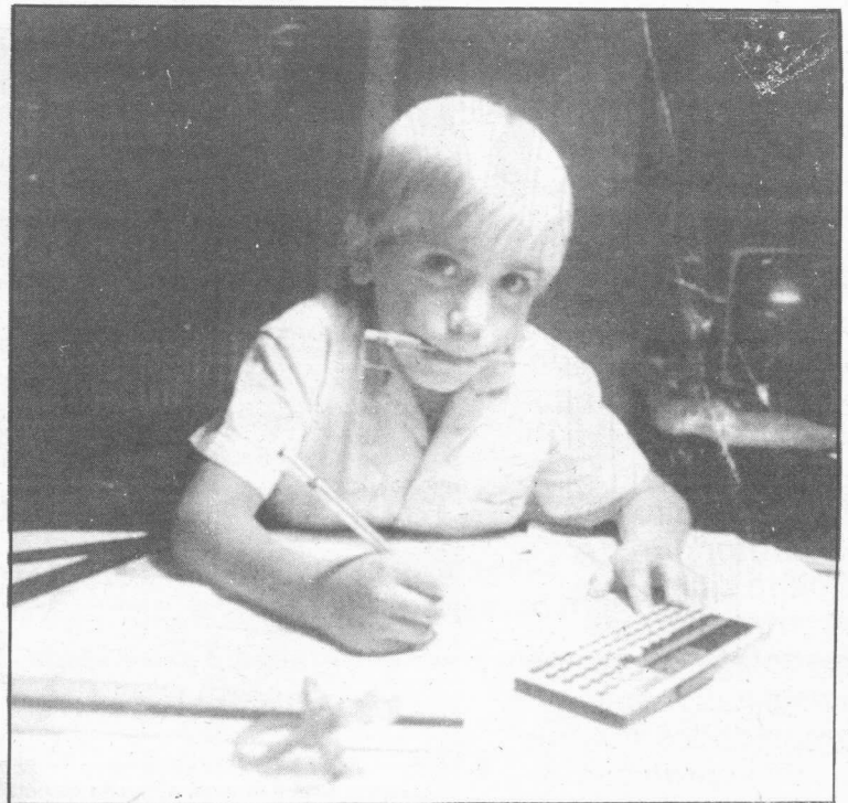
El 18% de los alumnos de sexto de EGB repite curso.

Más tarde, cuando los niños llegan a cursos más avanzados y tienen que estudiar en solitario materias desconocidas para sus padres, comenzarán a aparecer factores de conflicto adicionales ya que aproximadamente uno de cada diez alumnos se encuentra