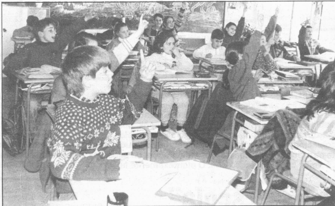
A lingua galega é materia obligada de estudos en todos os niveis educativos non universitarios.

O día 15 de xuño de 1983, aprobaba a Lei de Normalización Lingüística. La Lei, viña a ser un instrumento co que garantir a igualdade do galego e do castelán como linguas oficiais de Galicia e a asegura-la normalización do galego como lingua propia. O novo texto tiña a súa orixe na Constitución e mailo Estatuto de Autonomía. A primeira sinala que "as outras linguas españolas serán tamén oficiais nas respectivas Comunidades Autónomas de acordo cos seus estatutos".